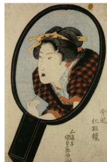
お歯黒（歯の黒染め）を示す江戸時代の浮世絵 歌川国貞『今風化粧』より