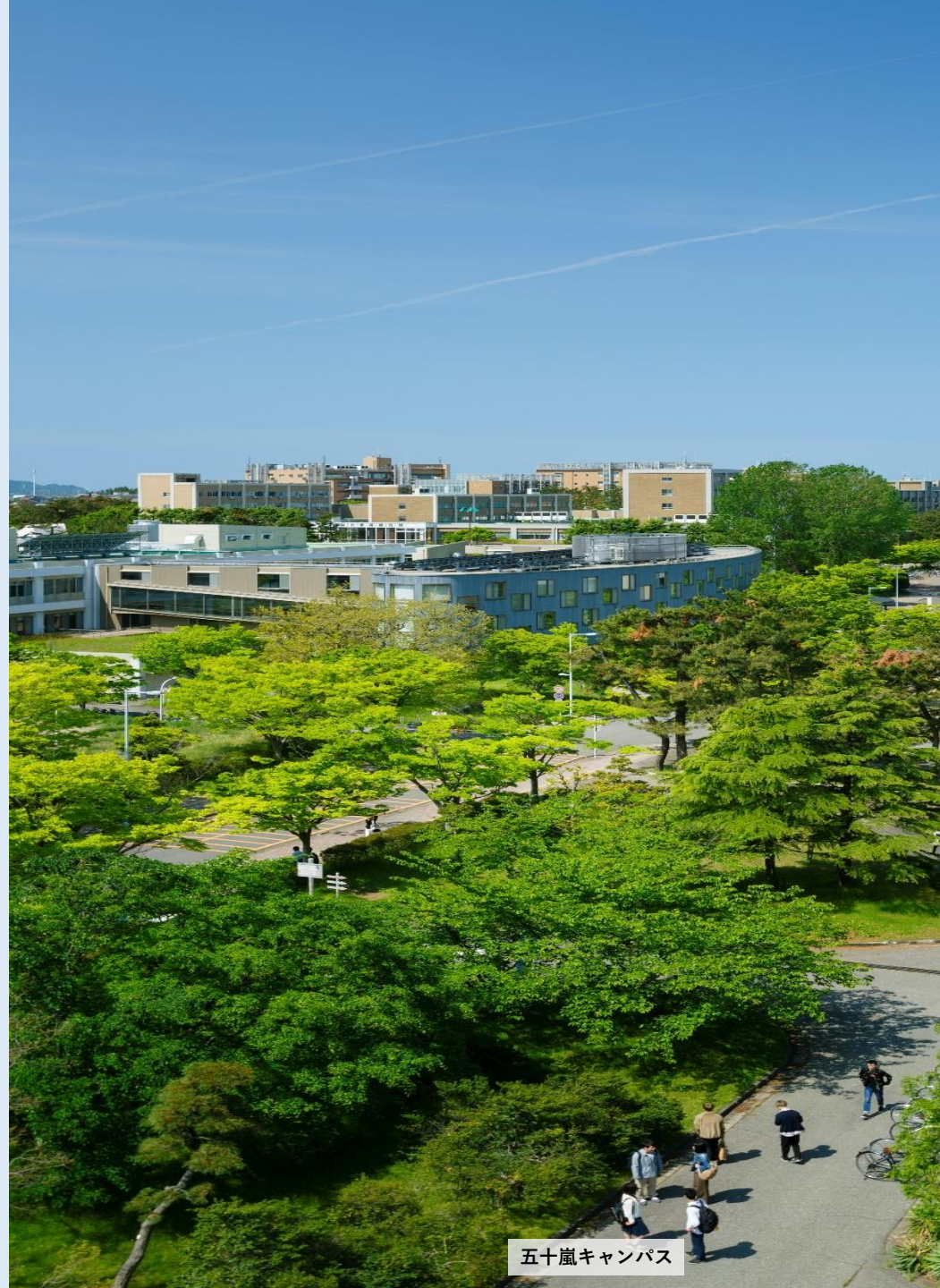
五十嵐キャンパス