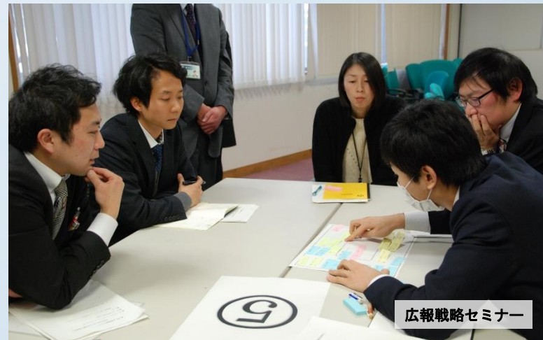
広報戦略セミナー