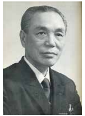
竹内忠雄(臨川)肖像