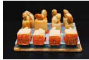
日下部鳴鶴自用印