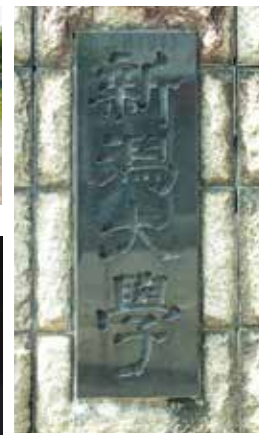
竹内の書を刻む旧正門の門標