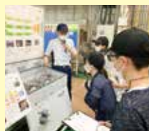
※インターンシップの様子

新潟県は創業100年を超える企業数が全国でも上位にあり、伝統の継承と時代に合わせた革新を繰り返しながら国内外で高い評価を得ている企業が多数あります。本科目は、新潟地域連携コミュニティ主催のインターンシップ体験事業 ※ を活用し、夏と春の長期休業期間に約1週間にわたり県内複数企業への訪問や社員取材を交えて実施します。新潟県内企業の魅力・強みと、それを生み出す背景や風土を深く理解するとともに、自身のキャリア観について新たな気づきを得ることもねらいとしています。