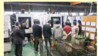
事後研修 株式会社テック長沢へ(学外)