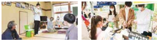
新潟県若手人材等による地域課題解決提案事業(専修大学森本ゼミ)

本科目を受講される皆さんには、実際に地域を訪れていただき、まずは、地域の現状に触れるとともに、何が課題なのか、また課題解決に向けて自分達に何ができるのかを考えていただきたいと思います。