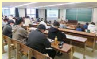
事前研修 柏崎の産業について(学内)

本講座は新潟県の補助事業であり、県内就職への意識を高めることも1つの目標としています。県内就職を支援し、地域振興を学ぶのが、この「地域振興論」であり、新潟の産業・企業を知ること「地域に学び、地域をおこす」ための人材育成を目指しています。