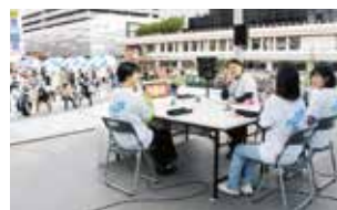
新潟市の万代シティパークで2022年11月に開催した鮭プロフェス。ステージで県内の学生が新潟を語り合った。

将来、どこに住み、どんな仕事をするか、その選択肢は多いほど夢も膨らみます。大学で、知っているようで知らない新潟を学びませんか。スマホを開いたとき、「鮭プロ」と検索してみませんか。「にいがたは、いつでもキミのミカタ」と語っています。