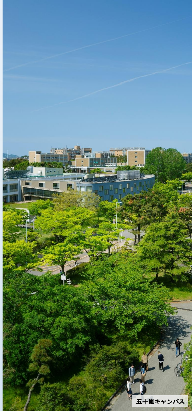
五十嵐キャンパス