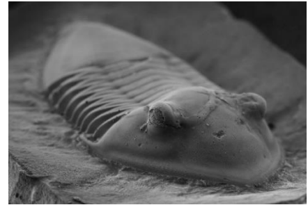
【写真】三葉虫イソテルス

今回実施する通信講座では、4.5 億年前の地球に生きていた「三葉虫」について、新潟大学で古生物学の研究をしている椎野勇太准教授が監修した通信教材を使って学習します。