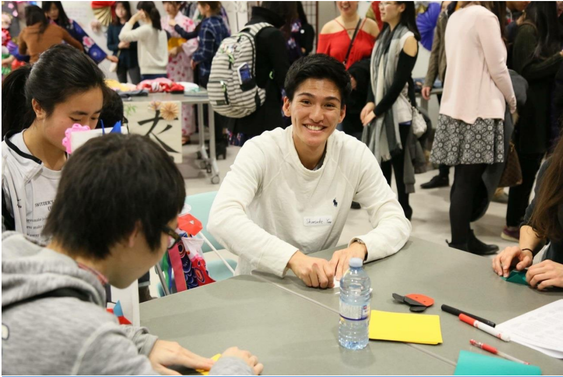
トビタテ生と Japanese festival を開催して、折り紙を教えている写真