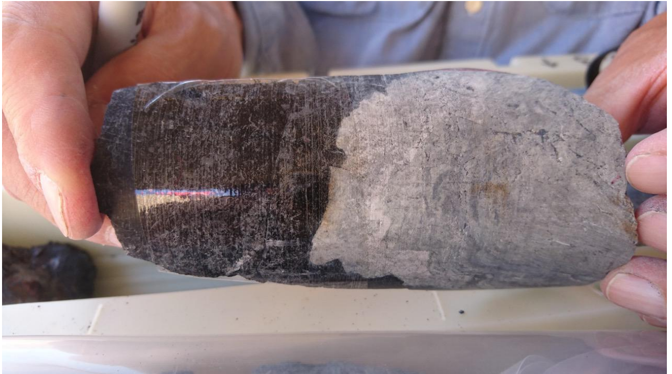
写真：オマーンオフィオライトの地殻－マントル境界付近コア試料。下部地殻を代表する斑れい岩（白）と最上部マントル試料のダナイト（かんらん岩、黒）が接している。