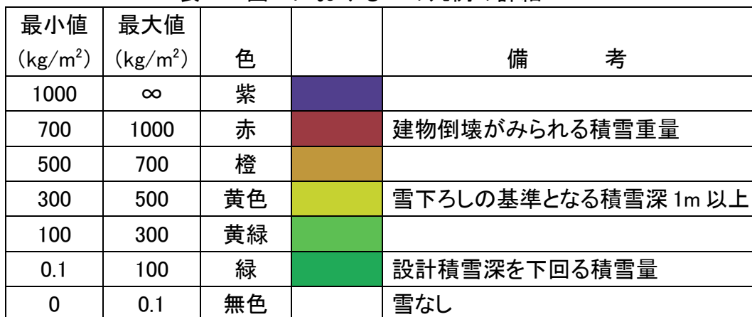
表1 図2におけるbの凡例の詳細

また、地図をドラッグすると示範囲を移動できる他、クリックしたらその地点における積雪重量の値が表示されます。