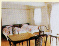
寝室 Bed Room