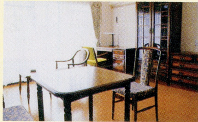
居間 Living Room

Beds, night table, desk, chair, bookshelf, drawing table, easy chairs, wardrobe, chest of drawers, cupboard, dining table, dining chairs, gas cooking unit, refrigerator, washing machine, dryer, shoe cupboard, fire extinguisher.