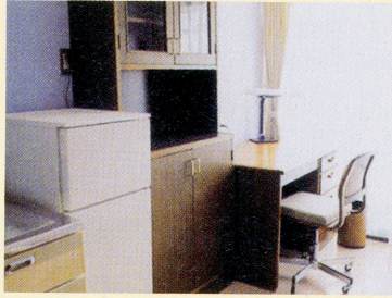
居間 Living Room

Bed, desk, chair, bookshelf, wardrobe, cupboard with table, gas cooking unit, refrigerator, and fire extinguisher.