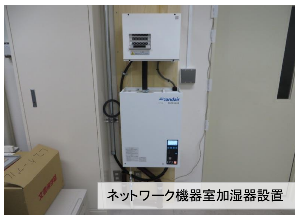
ネットワーク機器室加湿器設置