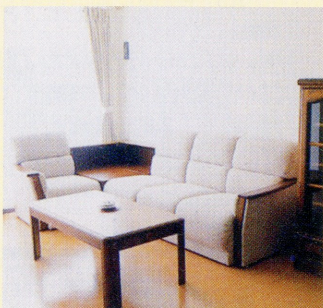
居間 Living Room