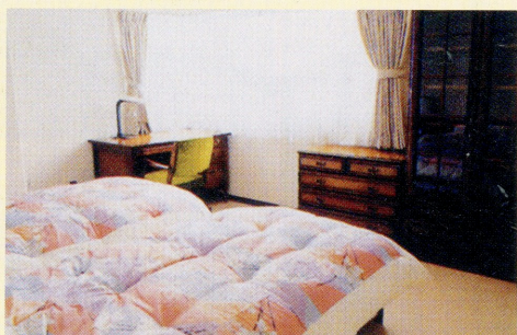
寝室 Bed Room