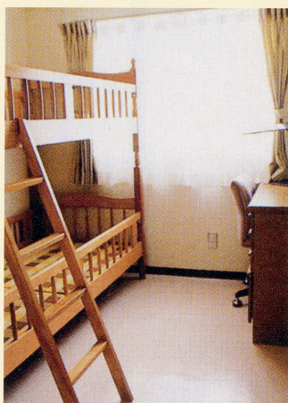
子供室 Children's Room