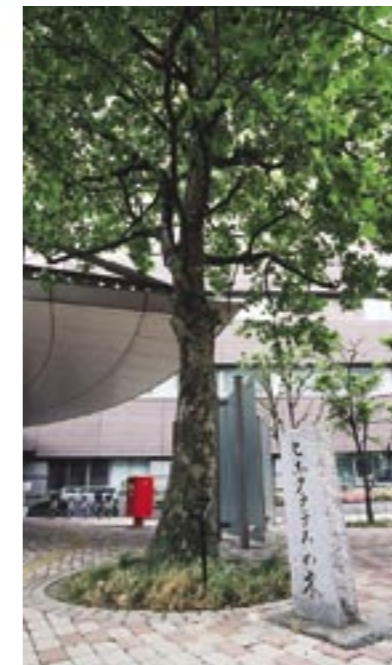
⑥ 医聖ヒポクラテスを記念した ヒポクラテスの木。