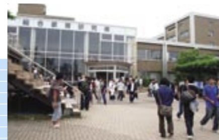
⑦総合教育研究棟 (人文学部・国際センター・キャリアセンター)