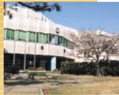
① 教育学部附属学校