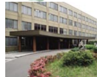
⑤ 医歯学総合病院医科診療棟