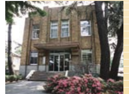
⑧ あさひまち展示館