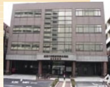
③ 医歯学総合病院歯科診療棟