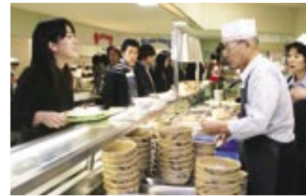
⑫第1学生食堂 ⑬第2学生食堂 ⑭第3学生食堂