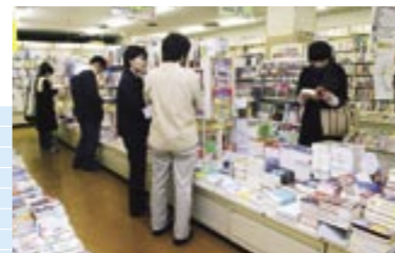
⑥厚生センター (1F書籍部 2F購買部)