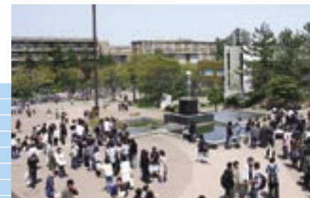
⑧第1学生食堂前の広場は多くの学生が集う場となっています。