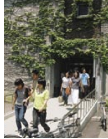
⑩人文学部・法学部・経済学部