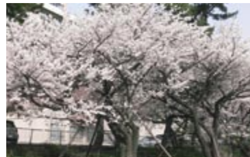
④ 旭町キャンパスの名物となっている桜は、 学生たちをはじめ多くの市民に春の訪れを告げる。