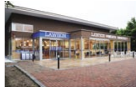
⑪LAWSON, NIIGATA UNIVERSITY