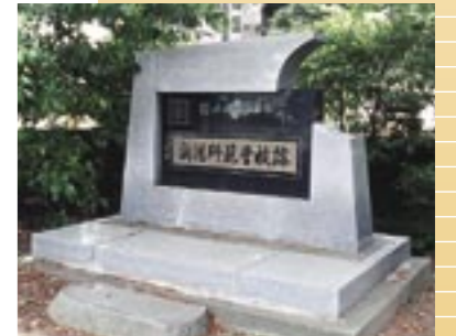
⑨ 新潟師範学校跡の碑