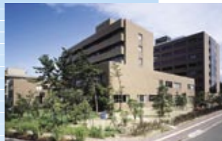
②自然科学研究科・技術経営研究科