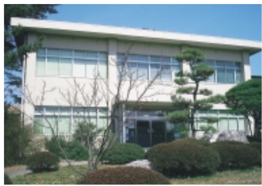
【保健管理センター】具合が悪くなったらすぐココへ。健康診断もやっています。