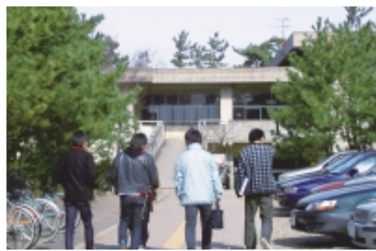
【大学会館・第3食堂】上は部活の集まりでよく使われる大学会館で、下は食堂になっています。