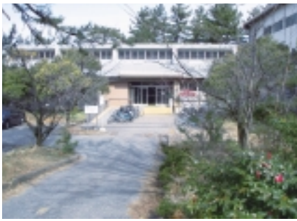
【体育館】体育の授業は主にここで行われます。