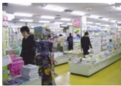
【生協】本や生活雑貨、さらに旅行のチケットもここで買えます。帰省のための旅券の手配もできますよ。