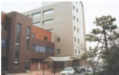
放送大学新潟学習センター 〒951-8122 新潟市旭町通1番町754番地 TEL:025-228-2651 FAX:025-228-2582