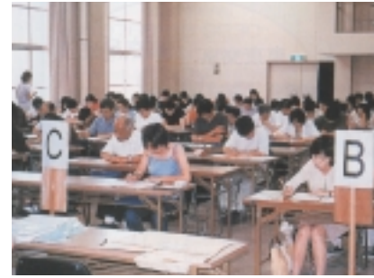
新潟学習センター「単位認定試験」